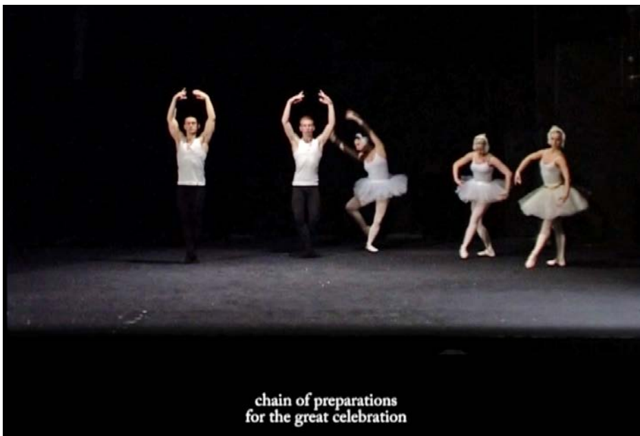
Une élévation arrondi retirée 2011, screenshot 06.07.15.