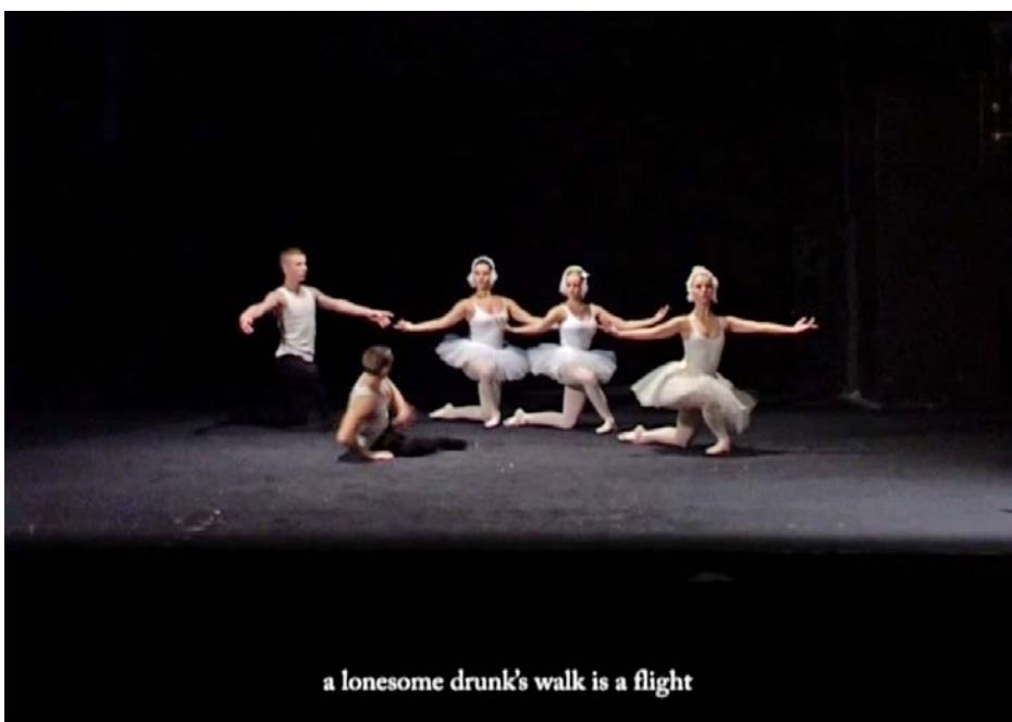
Une élévation arrondi retirée 2011, screenshot 06.08.50.